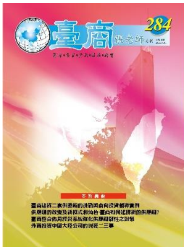
第 284 期封面