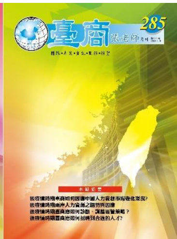
第 285 期封面