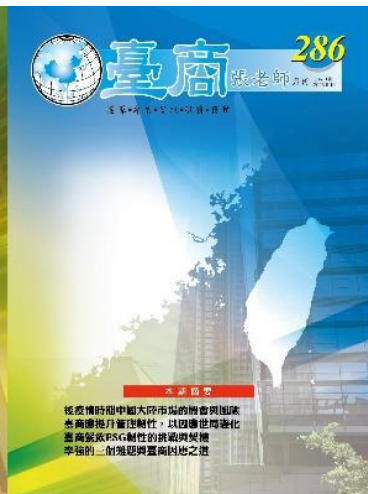
第 286 期封面