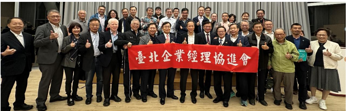
◆ 會員們會後與講師合影

演講內容非常精彩，大家獲益良多，最後在完成 Q&A 後，大家一起合照，活動圓滿結束。