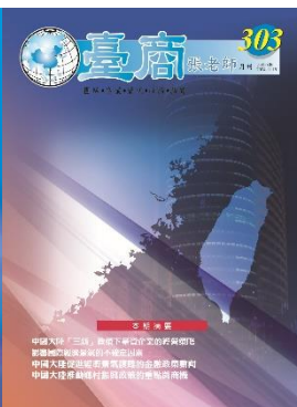
第 303 期封面