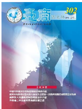
第 302 期封面

■第 304 期《臺商張老師月刊》已於 2024 年 12 月中旬出刊·本期焦點為「川普新關稅政策對台商之影響」由分組召集人袁明仁 (張老師)負責規劃安排。