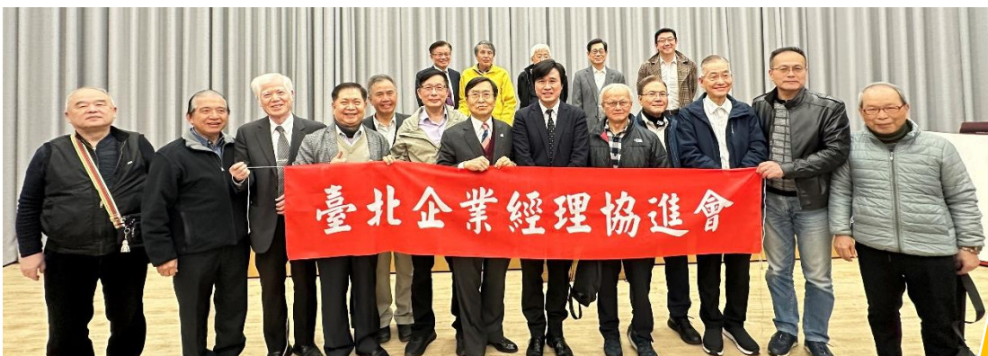
◆與會會員們會後合照。