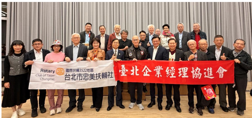
◆本會會員及協辦單位忠美扶輪社與講師合影