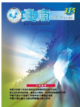
第 315 期封面