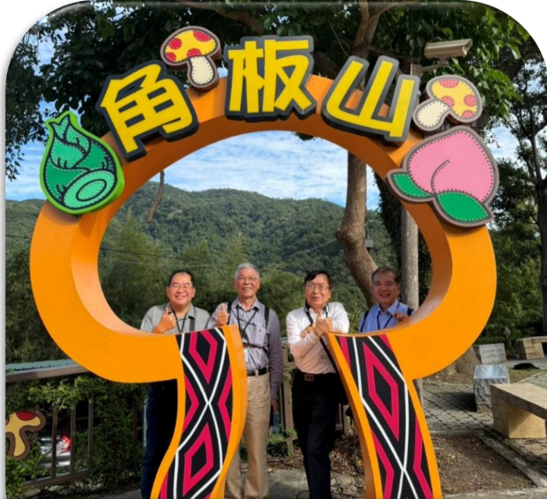
◆ 午後前往角板山公園及商店街自由活動。