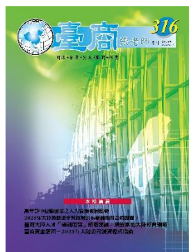
第 316 期封面