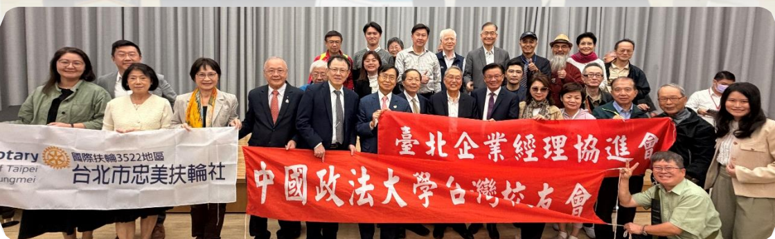
◆ 講師與本會會員、台北市忠美扶輪社與中國政法大學台灣校友會(協辦單位)合影留念